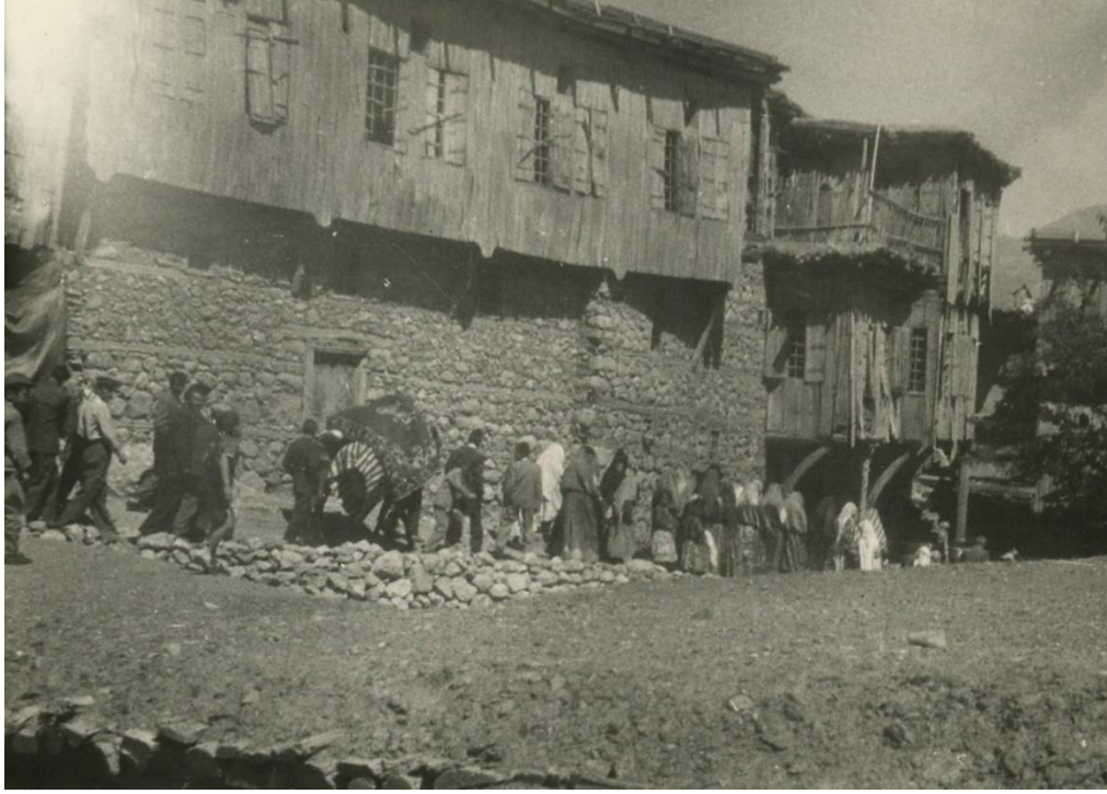
Resim 1. Düğün Kafilesi, Arapgir.

semer ve palanı süslenirdi. Göç başını çeken hayvanın çanı diğer hayvanların çanından büyük olurdu. Çan hayvanın çene altına, çingiraklar ise sağ ve sol yanlarına takılırdı. Hayvan her adım attıkça, başını sallayınca çan ve çingirak sesi ritimlerindi. Göç hayvanlarını götürüp getirmek vazifeli gençlere, erkek ve kız ailesi hediye ve bahşiş verilerek, ağırlandırdı. Çeyiz olarak zamanına göre; yatak takımı, halı, yastık, sandık, mutfak gereçleri ve diğer eşyalar gönderilirdi. Çeyiz bazen bir iki gün önceden de götürülür gelin odası düzenlenirdi.