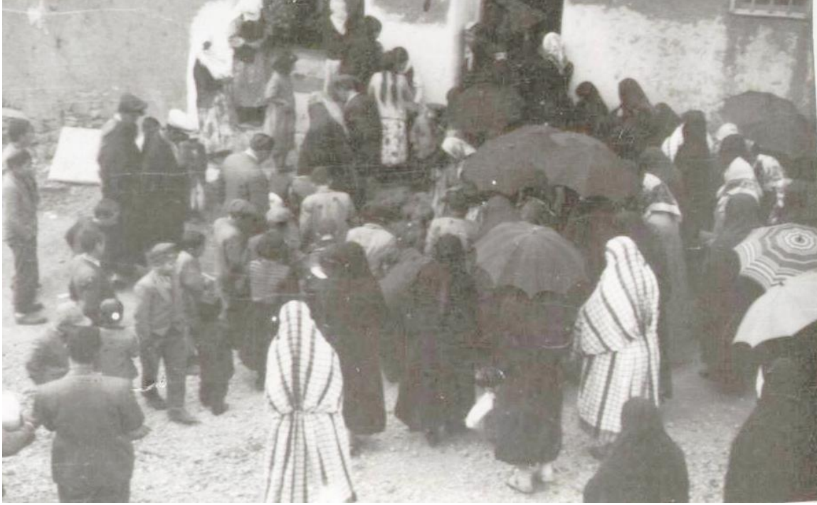
Resim 4. Gelinin Alınması, Arapgir (1957).

Gelin attan indirilince bir tarafına sağdıcın karısı diğer tarafında sağdıcın kız kardeşi geçerek gelin içeri götürülürdü. Gelin kapıdan içeri girerken kayınvalide Kuran’ı gelinin başına doğru tutarak, altından geçmesini sağlardı. Damat evine gelin getirilince kurban kesilir, kapıdan geçirilirken de altın takdim edilirdi.