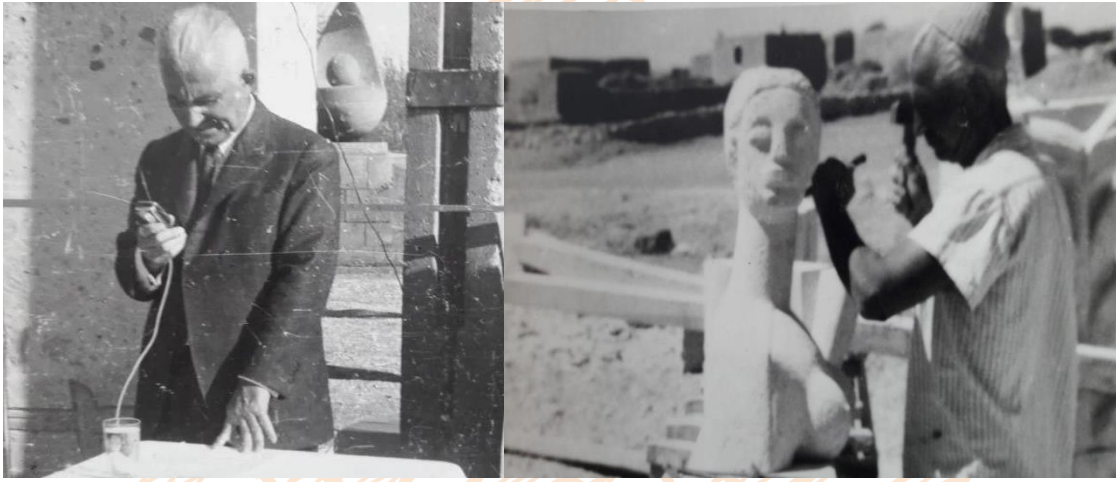
Görsel 3-4: Hakkı Atamulu

topraklara vefalı davranmış, insanı sevmiş ve onların geleceği için çaba sarfetmiş, emek vermiştir. Eserlerini gelecek nesillere aktarabilmek ve yaşatabilmek için Erciyes Üniversitesi'ne bağışlamıştır. Eserleri Kadir Has Merkez Kütüphanesi içindeki Hakkı Atamulu Sanatçı Evi'nde sergilenmektedir (Aytekin, 2006:30). Sanatçının 1912 de başlayan hayat yolculuğu 17 Temmuz 2006 yılında 94 yaşında solunum yetmezliğiyle son bulmuştur ( https://www.biyografi.info/kisi/hakki-atamulu ).