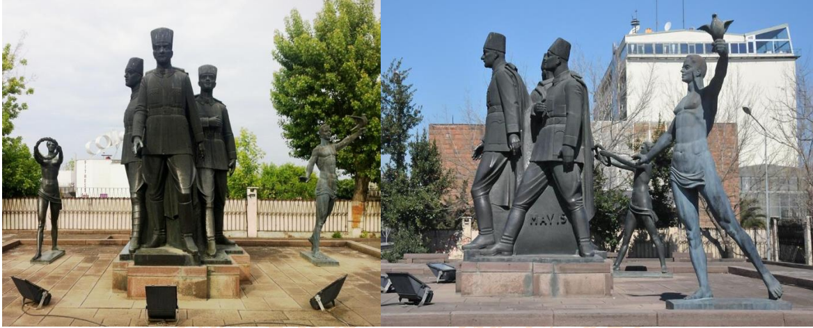
Görsel 15: Samsun İlk Adım Anıtı, Yükseklik:3 metre, Bronz

Samsun İlk Adım Anıtı, 1981 Yılında Samsun Belediyesi, Atatürk'ün 100. Doğum Yılı vesilesiyle heykel yaptırmak ister ve jüri Hakkı Atamulu'nun bronz döküm İlk Adım Anıtı projesini seçer. Atatürk ve arkadaşlarını simgeleyen üçlü figür ile bir kız bir erkek figüründen oluşan anıtın döküm işleri Budapeşte'de yapılır (Gezer, 1984:153-154). Samsun İlk Adım Anıtı yerleştirildiği alanda kendi mekânını yaratmış olmasındaki başarısı ve kompozisyon dengesi ile de ilişkilidir. Geride duran biri kız diğeri erkek iki figür ve ön tarafta bulunan üçlü figür gurubu hem kendi içinde hem de bütün olarak, etrafında dönebilme olanağı sağlaması açısından diğer anıtlarından farklı bir yere sahiptir.