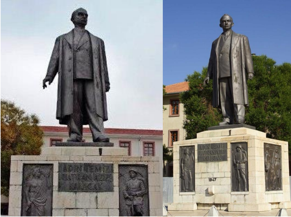
Görsel 5-6: Malatya İnönü Anıtı, Yükseklik: 6 m, Bronz

gözler önüne serilmiştir. Koyulduğu meydana kendi mekânını yaratmayı başarmış bir anıt heykel çalışmasıdır (Karataş, 2013:13-14).