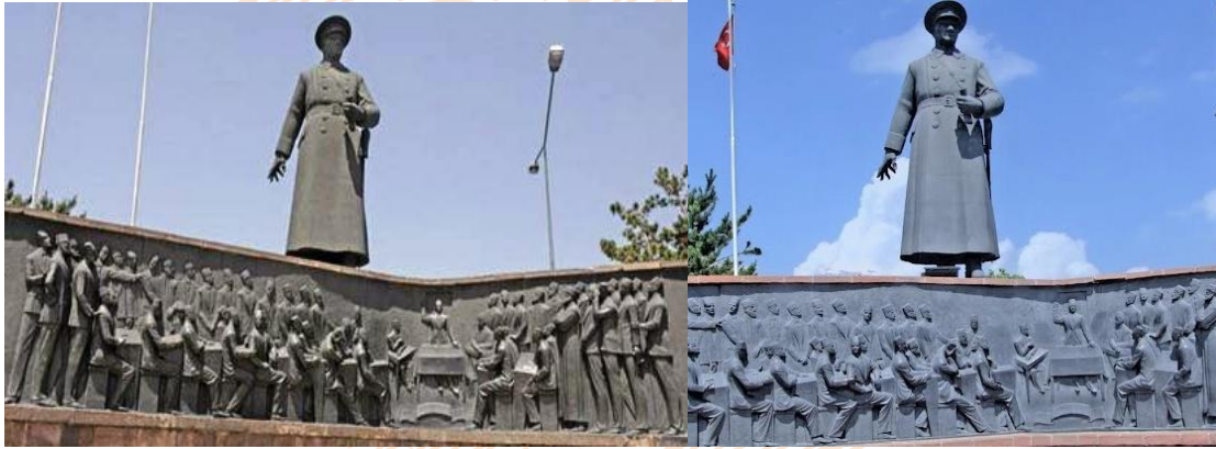
Görsel 11-12: Atatürk ve Erzurum Kongresi Anıtı, Yükseklik:3.5m., Bronz

Türk vatanının bütünlüğü ve bağımsızlığı üzerinde inanarak, inandırarak konuşuyor. O'nu dinleyen 56 delege tek bir yürek gibi çarpıyor, bu inanç çağlayanında ruhlar yıkanıyor, yüzlerinde gelecek mutluluk günlerinin ışıltısı var. Anıtın ikinci parçası. Kongreyi yankılatan bu kabartmaların arkasında yüksek bir seki üzerinde, 3,5 metre boyunda asker Atatürk Heykelidir. Bunda, doğacak devrimler sanki ruhundan dışına vurmıştır. (Başında general kasketi var.) Erzurum Kongresinin ulusça çarpışmanın 'Milli Mücadele'nin andını gerçekleştirecek adam, Türkiye Büyük Millet Meclisi Orduları Başkomutanı Mustafa Kemal... Bir eli kılıcında, öteki eli Osmanlı meclisinin imzaladığı Sevr Antlaşmasını buruşturuyor. Atatürk'ün bütün çizgilerinde kuvvet ile sabır öyle dengeli ki..." (Elibal, 1973: 272-273).