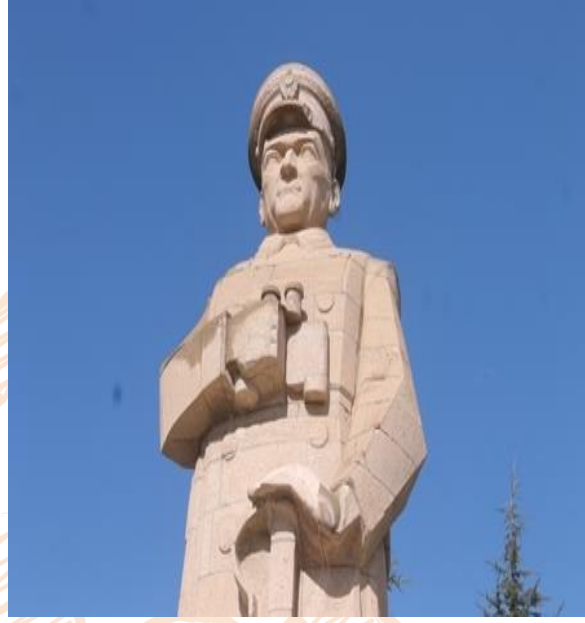
Görsel 13: Kùltür Park Atatürk Anıtı, Yükseklik: 9.30 m. Kaidesi ile 13.5 m., Taş