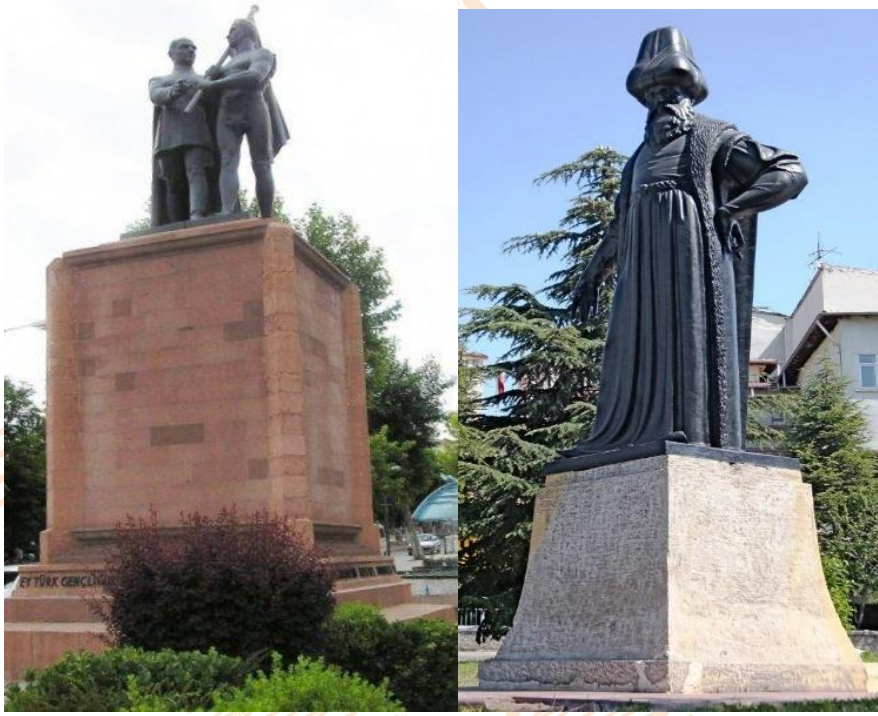
Görsel 7: Malatya Atatürk ve Gençlik Anıtı, Yükseklik:5 m, Bronz

Belling'in anıt çalışmalarında uyguladığı geleneksel anıt heykel düşüncesi, Hakkı Atamulu ve Nijat Sirel ortak yapımı olan bu anıtta da kendini göstermiştir. Anıtta yer alan figürler klasik heykelin iki güzel örneğidir. Figürlerde oran-orantı, kompozisyon ve ifade dengeli bir biçimde oluşturulmuştur. Yüksek taş kaide anıtın vermek istediği Atatürk ve Gençlik temasını yüceltmiş ve heykeli konusuna uygun bir hale getirmiştir (Karataş, 2013:16-18).