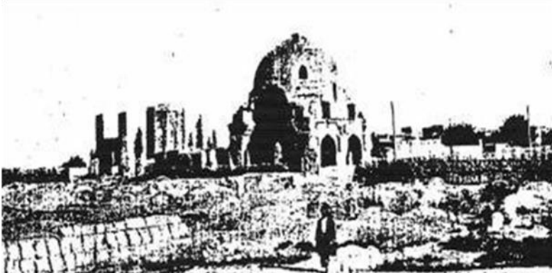
Resim-1 Cuma Mescidi Kümbet Çifte Minare, E. Yakobstal.

Dönemin en büyük şehirlerinden biri olan Nahcivan şehrinde merkezinde çok büyük külliye mevcut olduğu alman seyyah Alman Mimar E. Yakobstal XIX. yüzyılda yapmış olduğu incelemeler ve fotoğraflardan da anlaşılmaktadır. İldenizler döneminde yapılmış olan bu külliye içerisinde Çarşı, Cuma Mescidi, Çift Minareli taç kapı, Mümine hatun kümbeti ve konaklar mevcuttur. 3 (Resim 1-2-3)