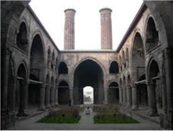
Resim-14: Çifte Minareli Medrese ve detay, Erzurum Ahlat