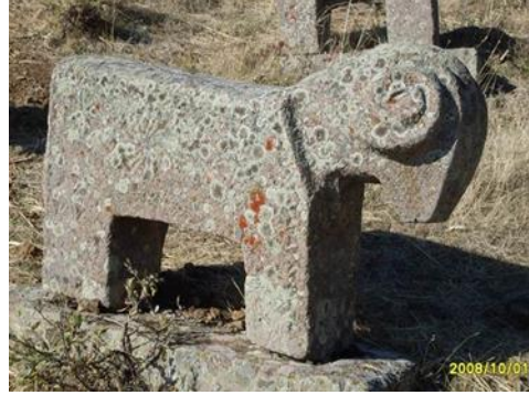
Resim 9: Koç Mezar taşı, Pülümür, Tunceli

Orta Asya'dan itibaren Ege denizine kadar Türklerin ayak bastığı birçok coğrafyada koç –koyun heykelleri görülmektedir, özellikle doğu Anadolu'da, Kafkas bölgesi Gürcistan, Ermenistan Azerbaycan, Nahcivan ve İran da yoğunlukla görülmektedir. Türk mezarlarında koç heykelleri önemli bir yer tutmaktadır. Üzerindeki geometrik desenler ve figüratif kabartmalar (rölyefler) anlam taşımaktadır.