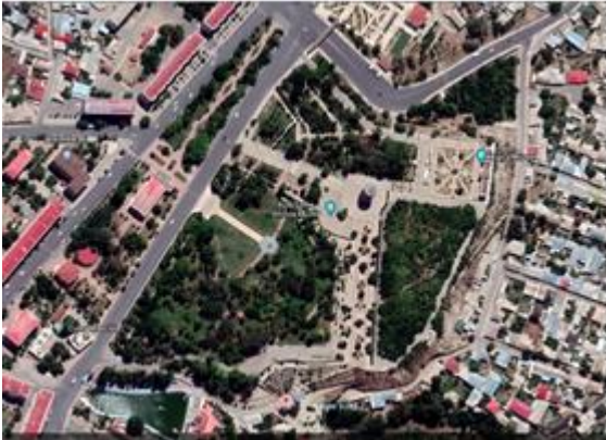
Resim- 6: Mümine Hatun Kümbeti. Kuşbakışı görünüşü.

Kümbet çevre düzenlemesine kuşbakışı baktığımızda (Resim 6-7) asimetrik bir geometri tasarımıyla oluşturulan çevre düzenlemesinde ana caddeye bağlayan birçok yaya geçişleri konulmuştur. Tüm alanın yüzde 60 a yakını yeşil alan olarak bırakılmıştır. Kümbetin kuzey doğusunda mümine hatun müzesi inşa edilmiştir. Kümbetin güney tarafına halı müzesi kurulmuştur. Her iki müzede tarihi bir özelliği olmayan mimari yapısında Selçuklu geleneği taşıyan geometrik tuğla örüntüsü verilmeye çalışılmışsa da tam bir bütünlük sağlanamamıştır. Kümbetin en yakınında oluşturulan ve kuzey cephesine bakan bölümde açık hava müzesi oluşturulmuştur.