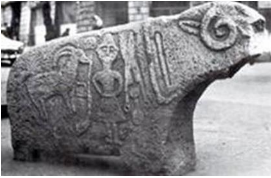
Resim 8: Koç heykeli Tiflis, Gürcistan Tunceli

ve bunun da eski Türkçe' de koyun/koç anlamına geldiği Çin kaynaklarından öğrenilmektedir. Ulu bir kavmin adı olan koyun/koç Oğuz kiliselerinde ve İslamiyet'in kabulünden sonra da cami ve mezar taşlarında yer almıştır". Ahlat'ta, Tunceli'de, Erzurum'da, Kars'ta ve Iğdır'da görülen koç/koyun mezar anıtları, bu durumun en canlı örnekleridir. Gene eski Türker'de olduğu gibi, yakınlarından biri ölen kimseye başsağlığı dilemeye gidenler, ölü sahibine verilmek üzere beraberlerinde koç/koyun götürürlerdi. Bugün Türkmenistan ve Kazakistan'ın birleştiği Mangışlak bölgesinde yaşayan Türkmenler bu geleneği devam ettirmekte ve mezarlarına koçbaşları koymaktadırlar. Anadolu'da ise, Dersim/Tunceli'de yaşayan Alevi-Zazalar ile Iğdır'ın Karakoyunlu ilçesindeki yerli Şii Caferi Türkeri'nin, Orta Asya geleneğinin bir devamı niteliğinde mezar anıtı olarak, ölen erkekse koç, kadınsa koyun heykeli diktikleri araştırmalarımız neticesinde tespit edilmiştir. 6 (Resim 8-9)