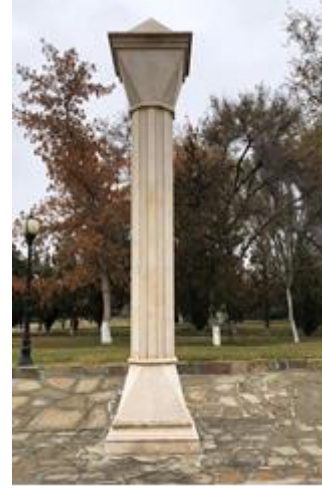
Resim 12: Sütunlu yol Mümine Hatun Kümbeti