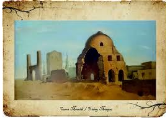
Resim-3 Görsel betimleme

Seyyahların yazdıklarından ve fotoğraflardan da anlaşıldığına göre mimari yapıların dizaynı ve çevre düzenlemesi günün şartlarına bağlı olarak bir düzen ve hiyerarşik düzenleme içinde olduğunu görmekteyiz. Yukarıda da bahsettiğimiz gibi Sovyet Rusya döneminde mimari yapıların birçoğu yok edilmiştir. Azerbaycan ve Nahcivan bağımsızlığını kazandıktan sonra kendi kültürünü ve kültür varlıklarını koruma anlamında çalışmalarına devam etmektedir. Bugün ayakta kalan ve iki defa restorasyon geçiren Mümine Hatun kümbeti çevre düzenlemesi ve açık alan düzenlemeleri yapılarak turizme açılmıştır. Konumuzu oluşturan Mümine hatun kümbet çevresi açık hava düzenlemesinin bugünkü durumuna geçmeden önce Mümine Hatun kümbeti hakkında ön bilgi oluşturmak gerekmektedir.