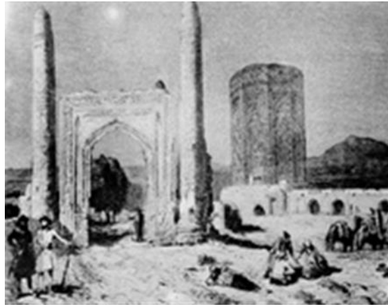
Foto 4: XIX. yüzyılda J. Laurens Tarafından yapılan bir gravürde (Elisé Reclus, Nouvelle Géographie Universelle, VI [1981],s. 176) TDV İslâm Ansiklopedisi'nin 32. cildinde, 294-297 numaralı sayfalarda yer almıştır.2006

Selçuklu Atabeyler döneminin yetiştirmiş olduğu mimar Acemi Ebubekir Oğlu Nahcivan'ını eserlerinden biri olan Mümine Hatun türbesidir. XII. yüzyıldan bölgenin en önemli şehirlerinden biri olan Nahcivan'ın şehir merkezinde büyük mimari kompleksinde yer alan Mümine Hatun Türbesi devrinin türbe mimarisini özünde yansıtan kümbetlerden biridir. Bu kompleksin içerisinde üç önemli mimari yapı bulunmaktaydı. Cuma Mescidi, Goşa (Çifte) Minare ve Mümine Hatun kümbetidir. 4 (Foto 4)