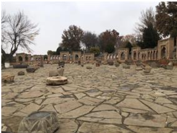
Resim-10: Açık Hava Müzesi, Koç heykel figürleri Nahcivan.

Konumuz olan Mümine hatun çevre düzenlemesi içerisinde yer alan açık hava koç-koyun heykel müzesinin düzenleme ve konuşlandırmasını aşağıda açıklamaya çalışacağız. Resim (10-11)